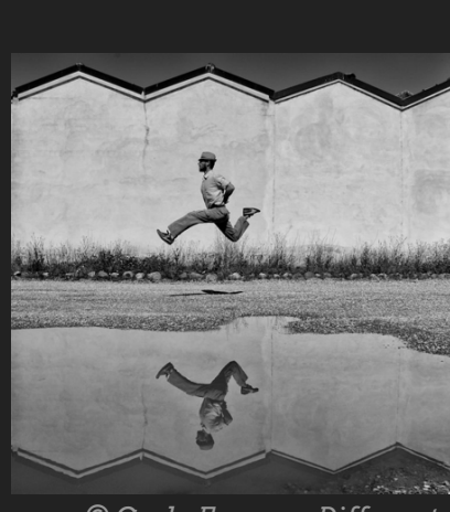
© Carlo Ferrara. Different perspective - 2020